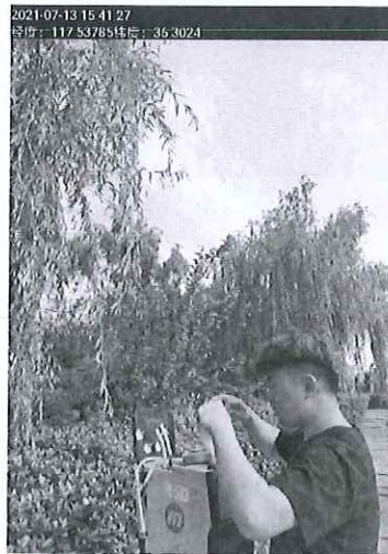
附件 3: 现场采样照片